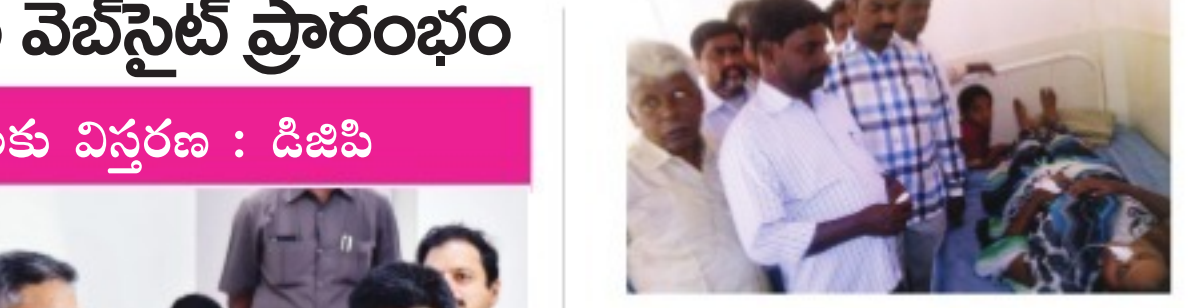
పోలీస్ వెబ్సైట్ ప్రారంభం కార్యక్రమంలో పాల్గొన్న అధికారులు